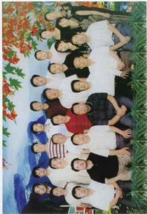
《陕甘宁边区三边分区史料选编》编（审）委员会成员合影